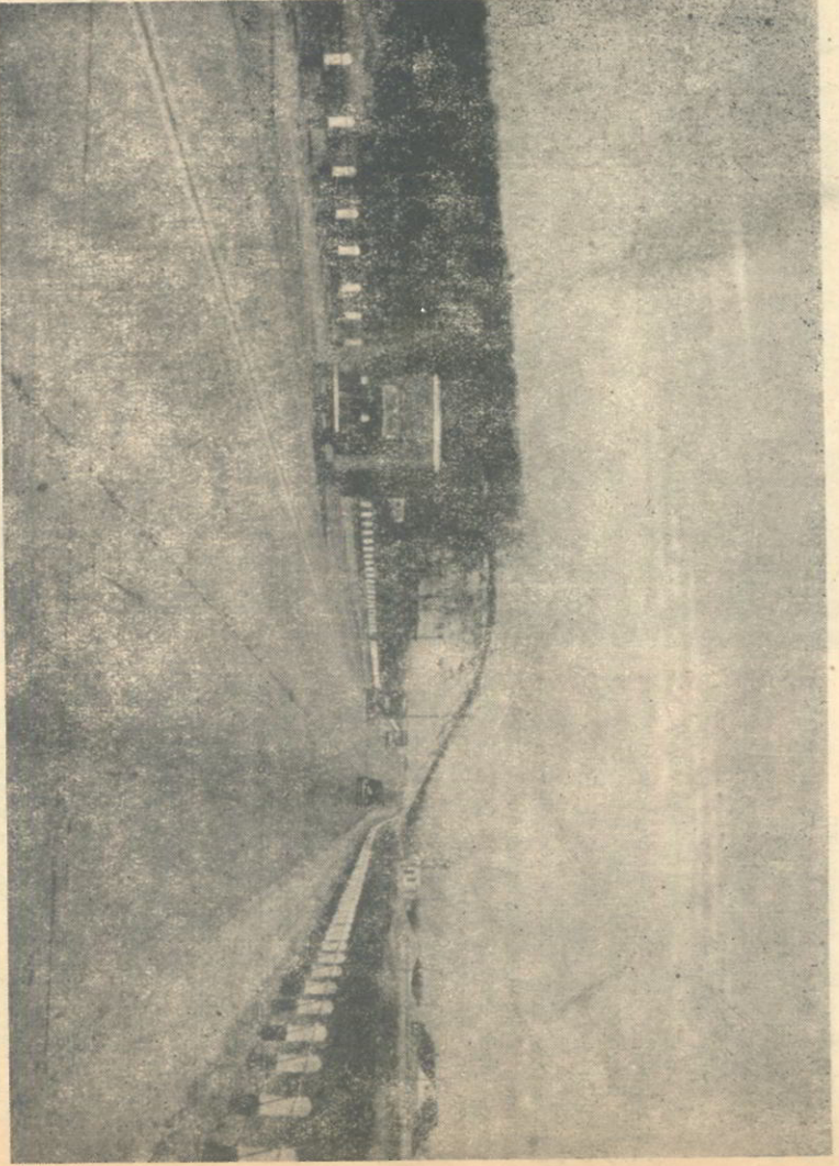
CHINA BEDRIJF SVETLOER

De Minister van Verkeeren Waterstaats van mening dat hulpmotorrijwielen (dus Rijwiel Solex) niet thuis horen op de snelverkeersweg doch gebruik moeten maken van de rijwielpaden. Voor ons goed nieuws want het Rijwiel Solex is o.i. geen motorfiets doch een fiets waarop men rijdt zonder te trappen.